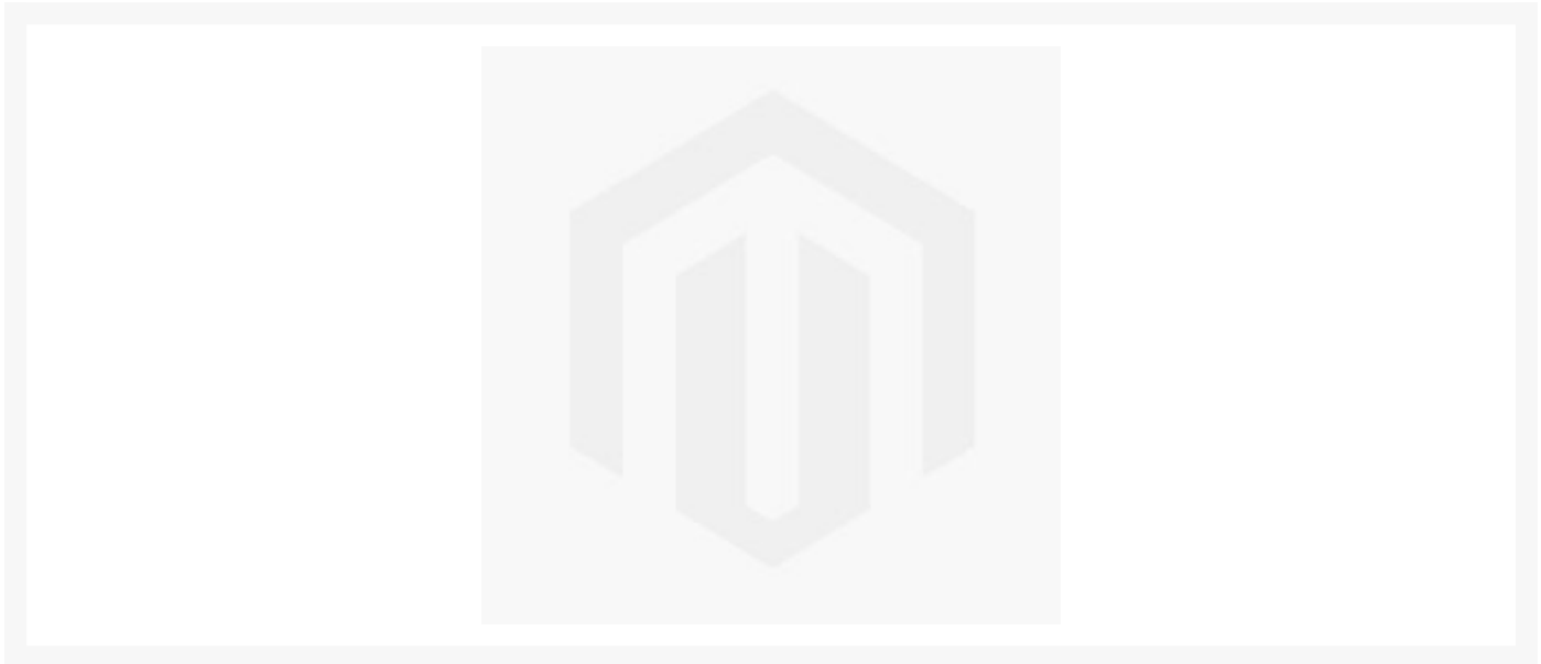
Heizpatrone 10mmx40mm mit 320Watt, 230V